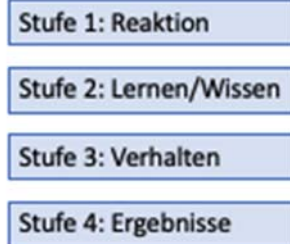
Abbildung 3: Die 4 Stufen des Kirkpatrick-Modells (eigene Darstellung in Anlehnung an Kirkpatrick 2006)

Für die Lehrer_innenfortbildung werden daher folgenden Fragestellungen immer wichtiger: Wovon ist es abhängig, dass Lehrer_innen im Rahmen von Fortbildungsmaßnahmen lernen, Kompetenzen erwerben und ihr unterrichtspraktisches Handeln so verändern, dass ihre Schüler_innen davon profitieren, und wie lassen sich diese Prozesse gezielt fördern und unterstützen.